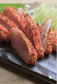
厳選鶏のむね肉炭火唐辛子炙り

豚タン刺、鶏刺し、熊本直送馬刺しをおまかせで3点盛りあわせて大変おすすめの肉刺し盛り。