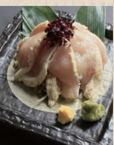
厳選鶏のむね肉炭火炙りたたき