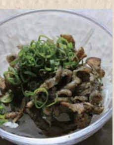
炭火焼、鶏皮塩ボン酢