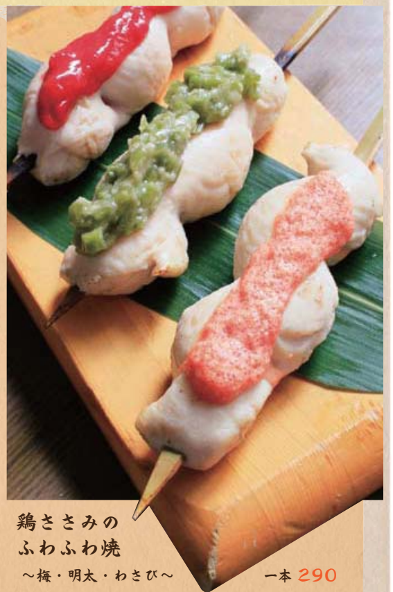
鶏ささみのふわふわ焼