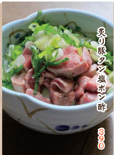
炙り豚タン塩ボン酢