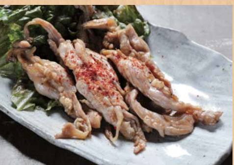
鶏せせりのカシス醤油焼き