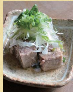
牛バラ肉の塩角煮