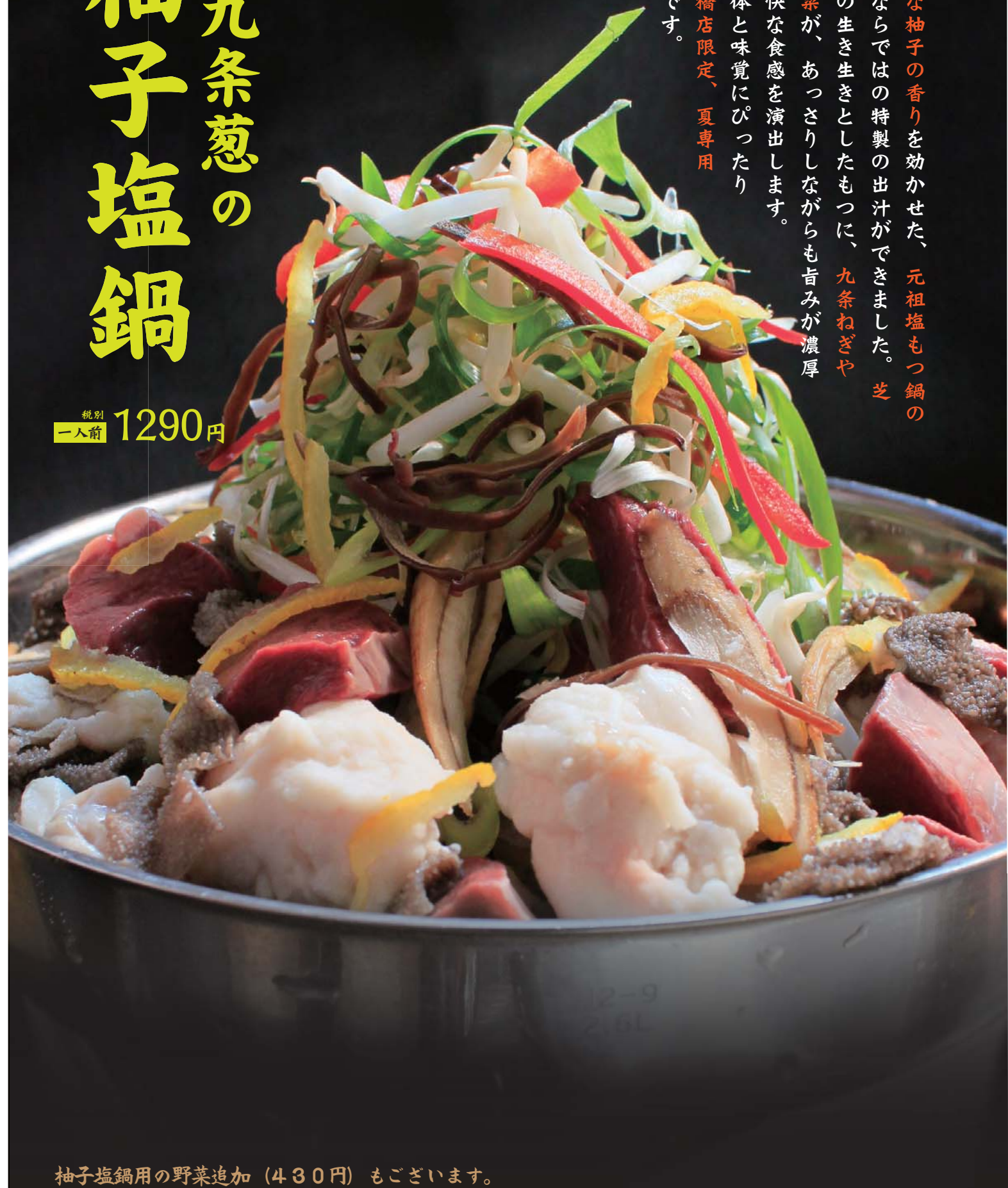
柚子塩鍋用の野菜追加 (430円) もございます。

爽やかな柚子の香りを効かせた、元祖塩もつ鍋のもつ福ならではの特製の出汁ができました。芝浦直送の生き生きとしたもつに、九条ねぎや新鮮野菜が、あっさりしながらも旨みが濃厚で、爽やかな食感を演出します。 夏の身体と味覚にぴったり の、新橋店限定、夏専用もつ鍋です。