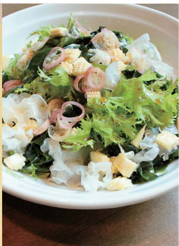
わさび菜と海藻の直七ボン酢