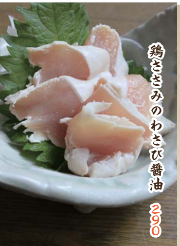
鶏ささみのわさび醤油