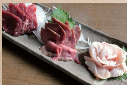
おまかせ肉刺し三種盛り