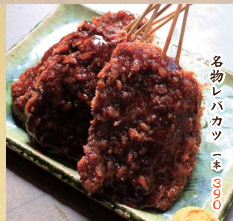
名物レバカツ 一本