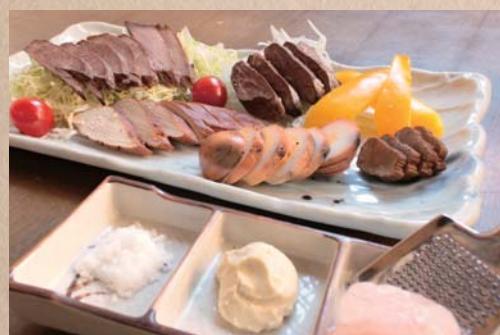
数量限定 手作り燻製盛合せ