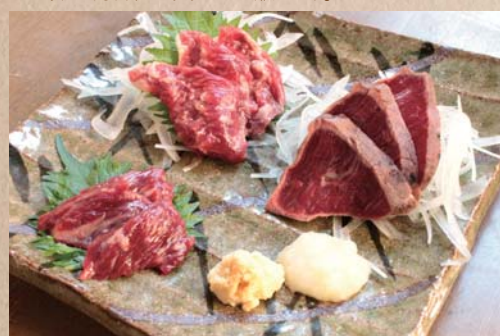
おまかせ馬刺盛三連福