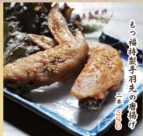
もつ福特製手羽先の唐揚げ