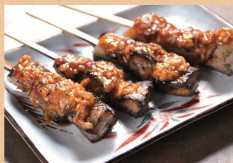
豚トロねぎ味噌串